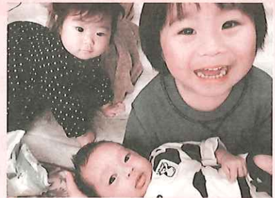
① 新生児への出生祝い事業