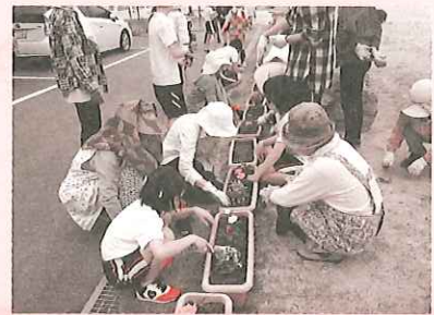
① 牟岐町婦人会連合会の市宇ヶ丘サポーター